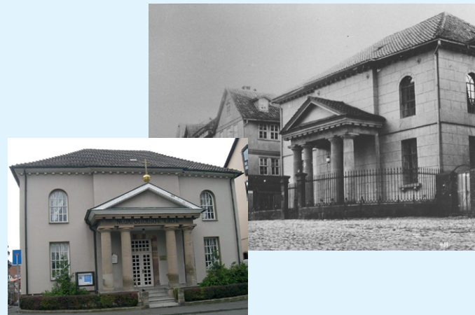
Die ehemalige Synagoge von Eschwege (r.) wird heute als Neuapostolische Kirche genutzt