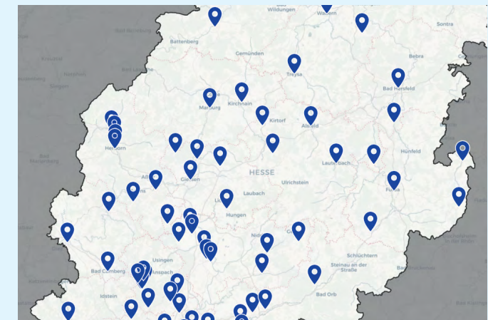
Interaktive Karte mit der Darstellung eines Suchergebnisses.