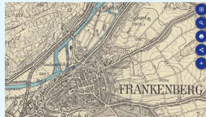
Karten-Anwendung „Topografische Karten“ mit Blättern aus verschiedenen Zeitschnitten