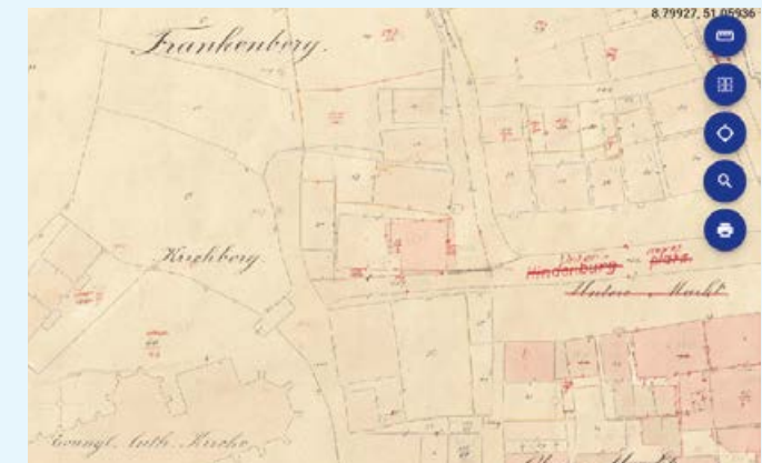
Ebenfalls direkt verlinkt: Die Karten-Anwendung „Urkataster+“