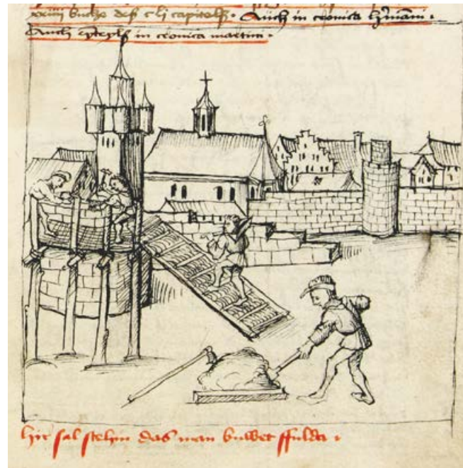
Ansicht von Fulda (um 1500)

Die jeweils eigenständigen Ortsartikel enthalten Angaben zu allen bestehenden oder untergegangenen Siedlungsplätzen in Hessen. Die Artikel sind in die Abschnitte Siedlung, Statistik, Verfassung, Besitz, Kirche und Religion, Kultur sowie Wirtschaft gegliedert, die sich ihrerseits aus zahlreichen Einzelinformationen zusammensetzen. In übersichtlicher und zu Vergleichen einladender Darstellung wird so über die historische Entwicklung von Städten, Dörfern, Mühlen und anderen Siedlungseinheiten mit einem eigenen Namen informiert.