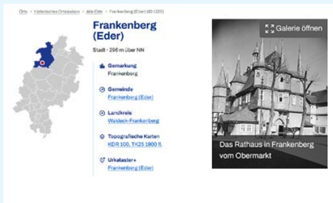
Beispiel für den Kopfbereich eines Ortsartikels (hier Frankenberg)

Literaturnachweise mit Direktlinks in die Hessische Bibliographie